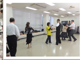
【体のメンテナンス講座】